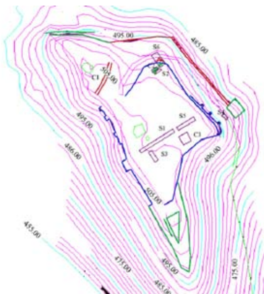
A görgényzentimrei vár alaprajza (2004). Lépték: 1:1000

találtuk meg. A 15. század második felében tereprendezés folyamán bontották el a régi konyhaépületet, és került a hulladéokra a járószintként szolgáló vastag habarcslemez. A habarcslemezt egy 15. századi kőműves csákány datálta, illetve szórványos kerámiatöredék. A konyhát az előkerült kerámia típusa alapján a 14-15. század elejére datáltuk. A kerámia zömét házihasználatú edények képezték, jelentős részük lassúkorongon készült, sőt előfordultak kézzel agyag hurkából készített edények is. Ez nem meglepő, hiszen a közeli Moldvában még a 15. század második felében is használják ezt a típusú házikerámiát és valószínű, hogy Erdély keleti felében is elterjedt lehetett még a 14. században.